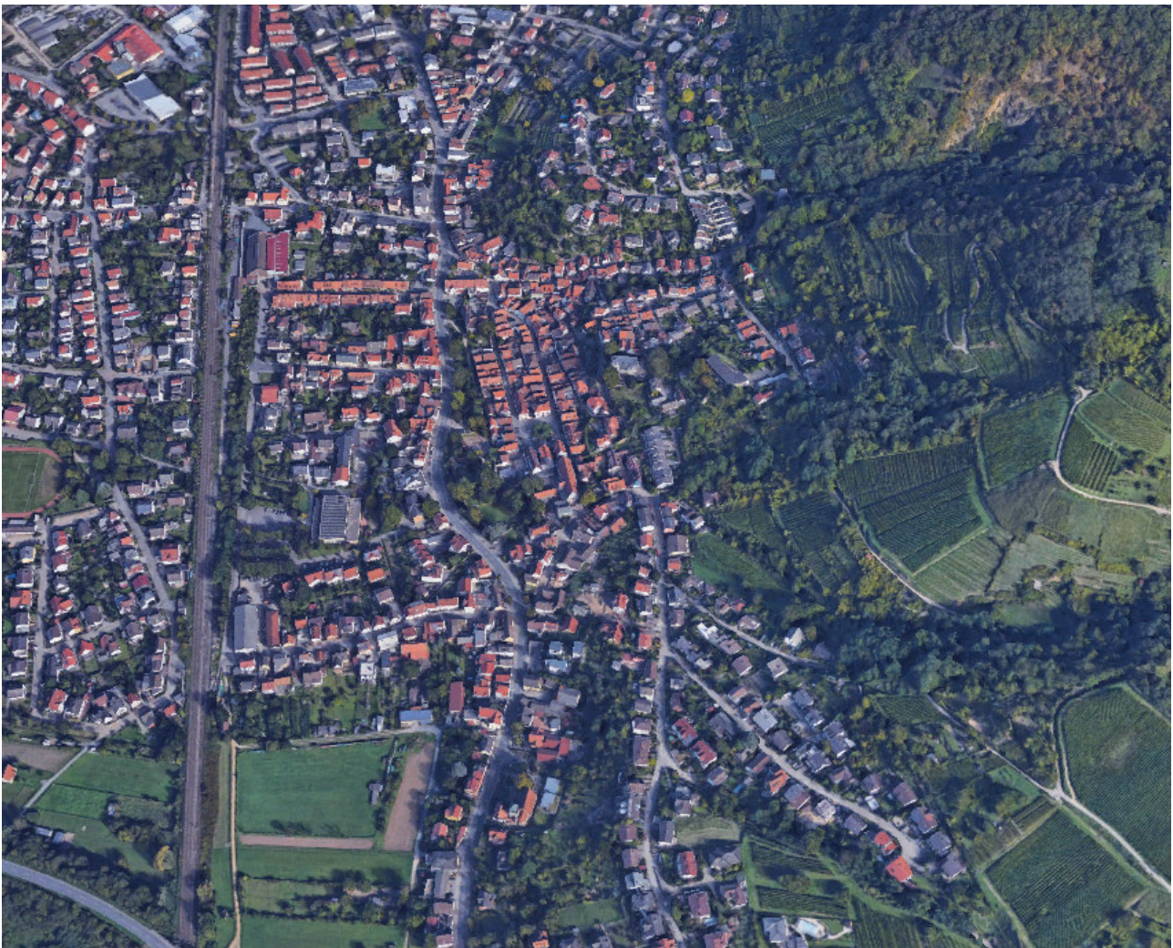
Abb.: Altstadt, Ausschnitt

Wie soll sich die Altstadt von Zwingenberg in den nächsten Jahren entwickeln? Das Leitbild für die historische Altstadt soll der zukünftigen Entwicklung der Altstadt einen Handlungsrahmen geben. Es ergibt sich aus Erkenntnissen, die in einem Beteiligungsprozess gesammelt wurden und ist damit individuell auf Zwingenberg zugeschnitten. Wenn neue Entwicklungen im Bereich Altstadt angestoßen werden, wird überprüft, ob sich diese mit dem Leitbild vereinbaren lassen. Das Leitbild basiert auf der Losung „Modernes Leben in historischen Mauern“ und greift damit die Lebendigkeit in der Altstadt sowie das Vorhandensein zahlreicher Funktionen, die den Stadtkern zum Mittelpunkt machen, auf. Beides sind große Stärken von Zwingenberg - mit dem Leitbild sollen sie mehr in das Bewusstsein gerückt und weiter verbessert werden.