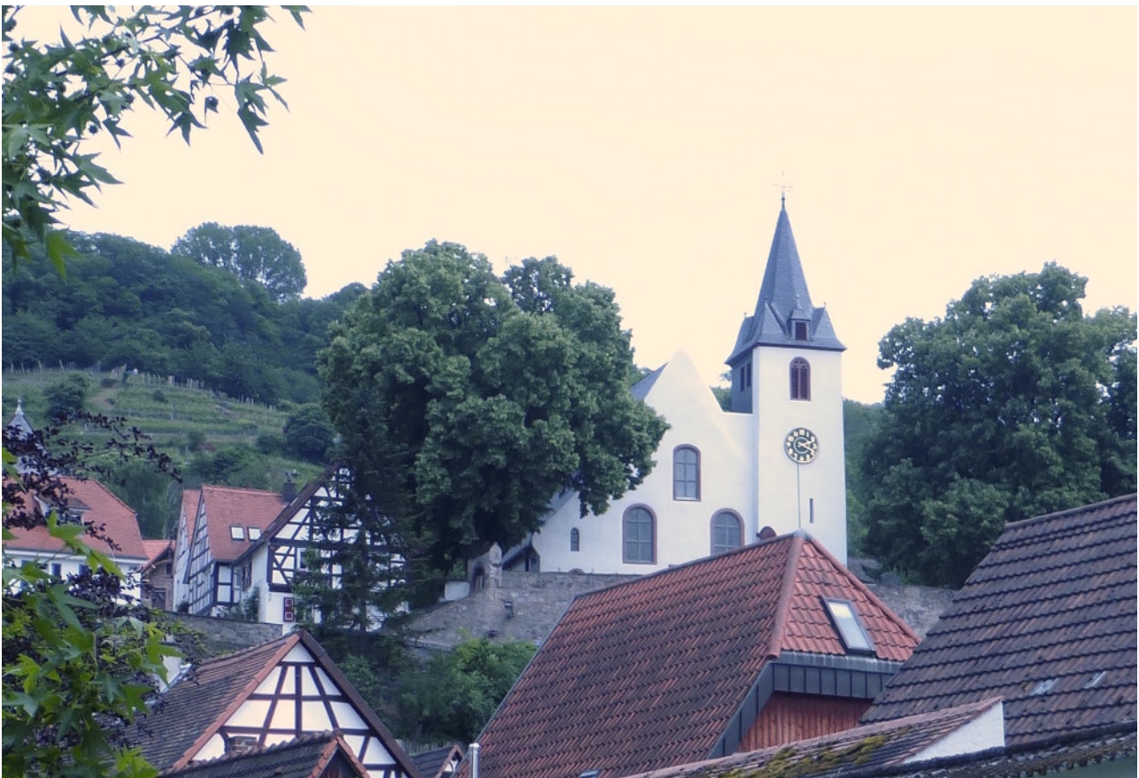
Abb.: Ansicht Bergkirche

Wohnen, Leben und Arbeiten in der Altstadt bleiben feste Faktoren in diesem Kernbereich. Das Leitbild stellt dabei verschiedene Aufgaben, wie die Aufwertung und Nutzung des öffentlichen Raumes, die verkehrliche Regelung, die Bewahrung des historischen Stadtbildes und die touristische und kulturelle Entwicklung in den Fokus.