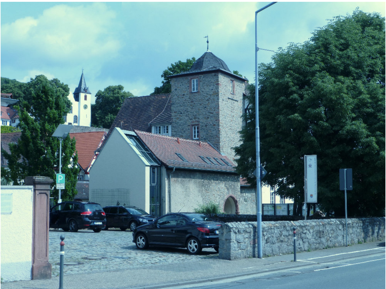
Abb.: Ansicht Zwingenberg von der B3